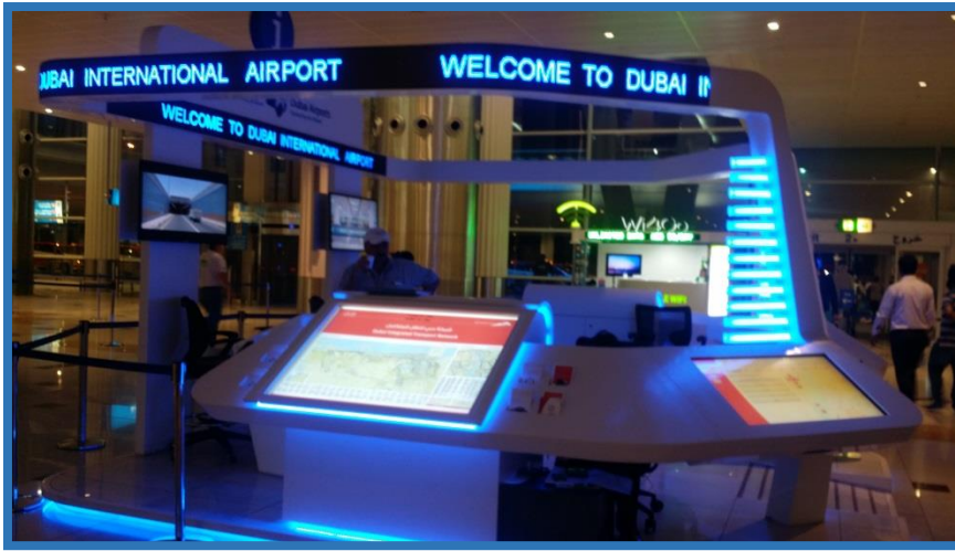
(DUBAI INTERNATIONAL AIRPORT INFORMATION)